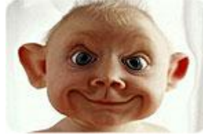
بتضحك على ايه !!!