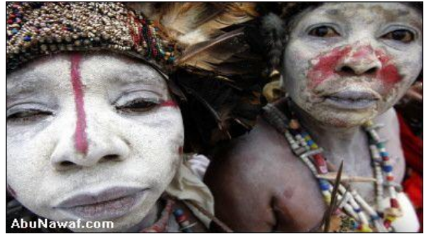
افراد من قبيلة واغينيا يصغون لكلمة رئيس الكونغو الديمقراطية جوزيف كابيلا لدى وصوله الى كيسانغاني السبت 16 تشرين الاول/اكتوبر 2004