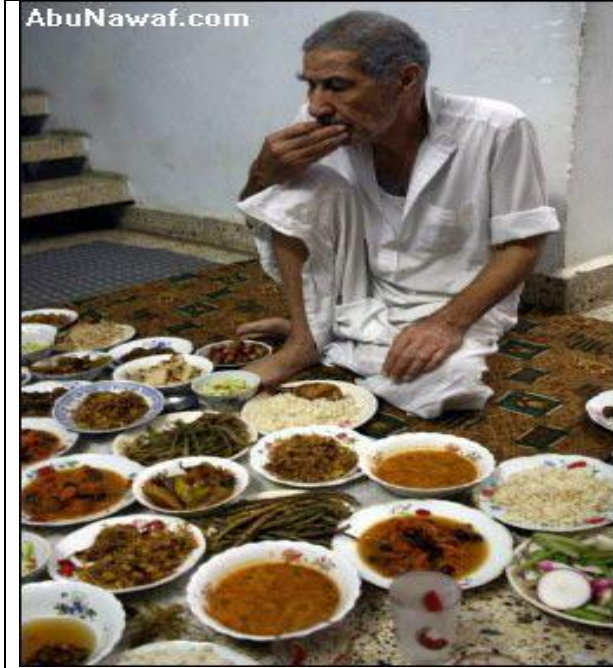
عراقي يتناول طعام الافطار في احد ايام رمضان في بعقوبة، 60 كلم شمال شرق بغداد