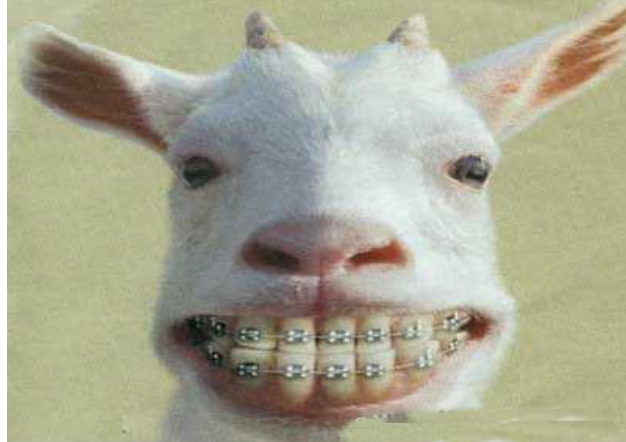
صورة 2 :مطلوب تعليق لهذه الصورة المراسلة على عنوان المجلة وسوف تقدم جوائز لأحسن تعليق