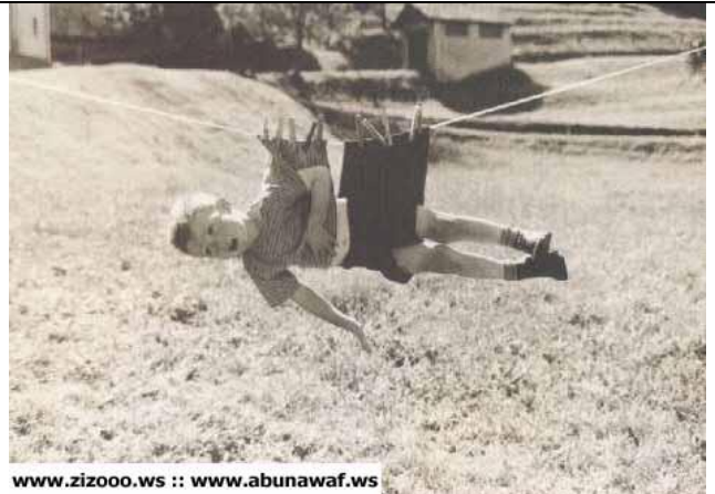
صورة 1 : مطلوب تعليق لهذه الصورة المراسلة على عنوان المجلة وسوف تقدم جوائز لأحسن تعليق