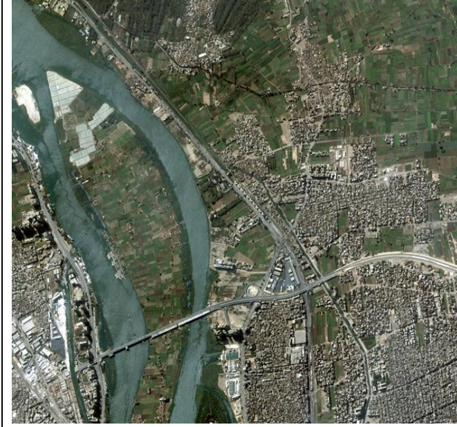
صورة القاهرة من القمر الصناعي