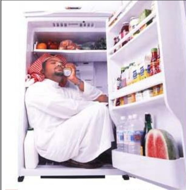
صورة 3 :مطلوب تعليق لهذه الصورة المراسلة على عنوان المجلة وسوف يتم نشر أحسن تعليق