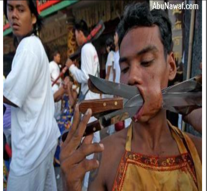
صورة 2 : مطلوب تعليق لهذه الصورة المراسلة على عنوان المجلة وسوف يتم نشر أحسن تعليق