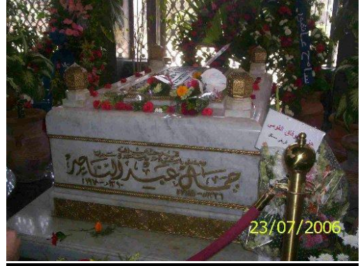
ضريح الزعيم عبد الناصر

وكان يصلي ع النبي عند الغضب والانبساط! من باب الاحتياط! أبويا طلعتوه حمار فكان طبيعيجيني جحش لا أعرف نبي من أجنبي ولا مين ما جاش ولا مين ما راحش موسى نبي أبوه نبي عيس نبي أبوه نبي كمان محمد كان نبي ويا قلبي صلي ع النبي وكلنا نحب النبي وكل وقت وله أذان وكل عصر وله نبي ****