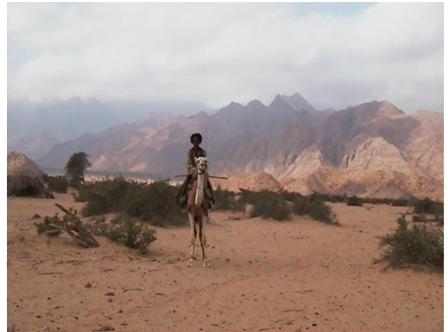
سلسلة من إعداد/ د. كريم ابوالعزائم