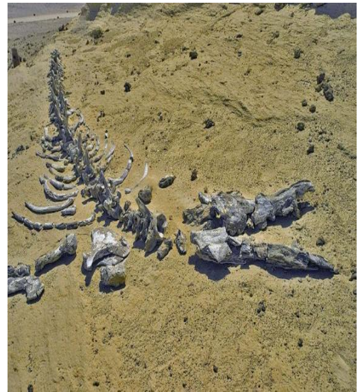
إعداد د. كريم ابوالعزائم