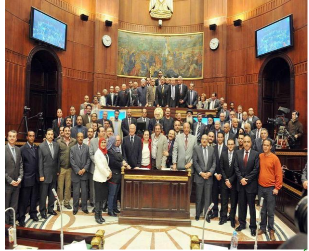
اجتماعات لجنة الخمسين للدستور

اجمعت آراء الشعب المصرى كله وبكل طوائفه على رفض الإرهاب والعنف وأن العنف كان دخيلا على الشعب المصرى شعب الحضارة والسلام وشعب الإيمان والتدين, ولكن جاء رفض الإرهاب بكل أنواعه بدءا من إرهاب العنف والتفجيرات والقتل والسجل مرورا بإرهاب التعسف فى استعمال السلطة وتفصيل القرارات التى لا تأتى إلا بالمزيد من العنف , وايضا إرهاب التهديد بالإقصاء ووصم المعارضين بالارهابيين وكذلك إرهاب الاستقواء بالخارج كأمريكا واوربا طلبا لمساعدتهم فى التخلص من النظام وهى صفة ليست من صفات المصريين على طول التاريخ ولكنه العناد والغباء اللذان جعلوا البعض منا يستقوى بأمريكا طلبا وهروبا من تعسف الحكومة وهو هنا كالمستجير من الرمضاء بالنار !!!!!!! ولا ننسى إرهاب الاعلام جميعا الاعلام الحكومى والاعلام الخارجى ولنا فى تحيز الاعلام الحكومى ضد المعارضين لأكبر صورة من صور الارهاب وكذلك تحيز الاعلام الخارجى مثل الجزيرة والبي بي سى وقنوات تركيا وغيرها التى تصب النار على الزيت ليس حبا فى المعارضة وليس كرها فى الحكومة ولكنهم ينفذون أوامر ماما أمريكا حتى تتفكك مصر ويضيع العالم العربى والاسلامى , وهى الخطة الجهنمية التى تلعب بها امريكا وإسرائيل فى كيف نتخلص من آخر الجيوش العربية ( جيش مصر ) وشعب مصر حيث كان الجيش المصرى والشعب المصرى هما الصخرة التى تتحطم عليها هجمات الاعداء للعرب والمسلمين , وما معركة حطين وانتصار المسلمين بقيادة صلاح الدين والجيش المصرى على الصليبيين وكذلك معركة عين جالوت وانتصار قطز والجيش المصرى على التتار واخيرا معركة حرب رمضان (عبور اكتوبر 73) ببعيدة عن عيوننا ..... إن الموضوع خطير والمصاب جلل ولكن عبقرية الشعب المصرى أكبر إن شاء الله.