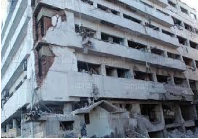
تفجير مبنى مديرية أمن الدقهلية

إرهاب العنف وإرهاب السلطة وإرهاب الإقصاء وإرهاب الاستقواء بالخارج وإرهاب الإعلام وإرهاب الكذب والتضليل وإرهاب الغباء وإرهاب العناد