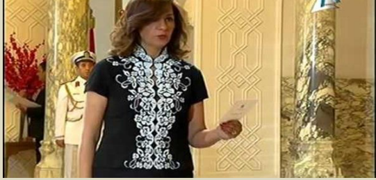
نبيلة مكرم وزيرة الهجرة والمصريين العاملين بالخارج

أكثر من خمسة ملايين مواطن مصري يعملون بالخارج.. يحتاجون إلي وزارة خاصة بهم.. مسؤولة عنهم.. تتواصل معهم عبر خط ساخن يكتب علي جواز السفر.. وزارة تعرف مشاكلهم وهمومهم.. وتتابع نجاحاتهم والاستفادة من خبراتهم. نحن في حاجة إلي وزارة تعتنى بجزء مهم من الشعب المصري اضطرته الظروف.. أو اضطرته ظروفه للسفر والعمل بالخارج في الوقت الذي يحلم فيه بالعودة إلي وطنه وتحقيق حلمه لبدا حياة جديدة يختارها هو لا أن تفرض عليه فرضاً! لقد جاء التعديل الوزاري واعاد فكرة وزارة للهجرة والمصريين المغتربين.. وقد كانت هناك وزارة بالفعل تحت هذا المسمى في حكومات مصرية سابقة في الوقت الذي كان عدد المصريين العاملين بالخارج لا يزيد علي المليونين! لقد آن الأوان في أن نفكر في مواطنينا بالخارج وان نعمل على مساعدتهم بقدر ما يقدمونه لمصر فالمصريون في الخارج هم اكبر مصدر للدخل القومي من العملة الصعبة وهم كنز مصر من الخبرات ، فما اجدر ان تعطى مصر لهم خدمة قد تكون بسيطة ولكن مردودها اكبر . إننا نريد من وزارة الهجرة والمصريين بالخارج ان تعطى التسهيلات للمصريين مثل الاعفاء من جمارك السيارة والاسبقية في حجز الاراضي والمساكن بالدولار والعملة الصعبة ومقابل ذلك يقوم المصريون بتحويل مدخراتهم بالعملة الصعبة لمصر وهكذا تستفيد مصر من ابنائها وتساعدهم بقدر ظروفها. إننا ننتظر الكثير من وزيرة الهجرة ومستعدون بالكثير حبا في مصر وتحيا مصر.