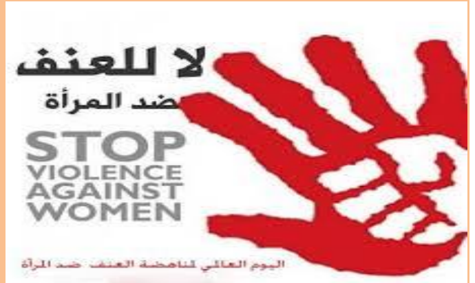
لا للعنف ضد المرأة