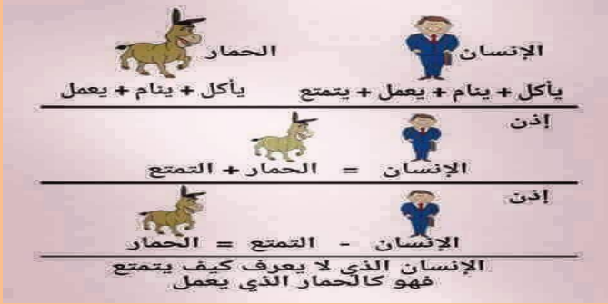
الانسان و الحمار