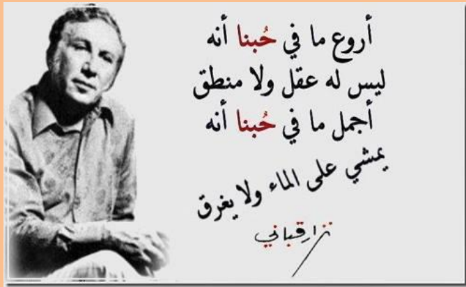
أروع ما فى الحب