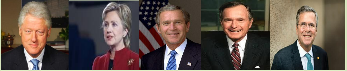
بيل كلينتون (مرشحة الرئاسة) هيلارى كلينتون

صفحة المنوعات: الانتخابات الامريكية بالوراثة (آباء وزواج وأخوة) اختيار مصطفى عبدالله.