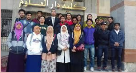
صورة لحفل تخرج دفعة من كلية دار العلوم