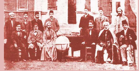
هيئة التدريس بدار العلوم عام 1897

بعد سنوات طويلة...تصل مع بداية العام الجديد إلى 144 عاما كانت ومازالت كلية دار العلوم هي الصرح الذي استطاع أن يحمي اللغة العربية، ولهذا نعتبرها كلية فريدة من نوعها، أنشئت بفرمان الخديو اسماعيل الذي استوعب تجربة باريس التعليمية، وكانت البداية في قاعة بدار الكتب حيث أطلق على هذه القاعة اسم "دارالعلوم" إن فكرة دار العلوم كانت جديدة تماما على المجتمع المصري، الذي مرت عليه قرون متعاقبة وهو لايعرف سوى العلم اللغوي والديني، الذي كان يدرس في مركز التعليم الوحيد لديه، وهو الأزهر الشريف، فأراد على مبارك بتنفيذ هذه الفكرة ان يضع أساس التقدم العلمي الحقيقي، الذي لاينهض بجناح واحد من جناحي العلوم، كما انه لايستمر بدون مواجهة الواقع الجديد بماينشأ فيه من علوم مستحدثة إن المحاضرين كانوا من كبار الأساتذة المصريين في ذلك الوقت إضافة للأجانب الذين يلقون محاضراتهم باللغة الفرنسية ، ثم يتولى أحد المدرسين المصريين بالترجمة للعربية. أما الحاضرون فكانوا من كبار موظفي الحكومة، وموظفي نظارة المعارف ومدرسيها، وطلبة المدارس العالية، وفريق من طلبة الأزهر، وكان على مبارك يحضرها بنفسه مما كان له الأثر الكبير في تحويل فكرة دار العلوم إلى مدرسة نظامية، وخاصة حين طلب من شيخ الأزهر ترشيح عشرة من نجباء طلاب الأزهر يحضرون بعض دروس دار العلوم (العربية والشريعة)، ويربط لكل منهم خمس وعشرون قرشا إعانة لهم من ديوان الأوقاف. ولهم الحق في حضور الدروس الأخرى كالفلك والطبيعة، ويُنخب منهم المدرسون عند الحاجة) كما أن بعض أساتذة الأزهر شاركوا في التدريس لهؤلاء الطلاب بدار العلوم المعروف أن على مبارك هو من تقدم بمشروع مدرسة دار العلوم إلى الخديو إسماعيل في 30 يوليو سنة 1872 جاء فيه