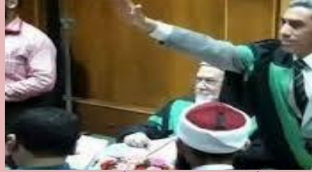
رسالة ماحيستير في كلية دار العلوم