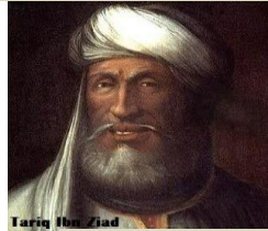
طارق بن زياد