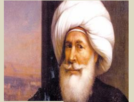
محمد علي باشا

طارق بن زياد (الامازيج) قائد عسكري مسلم، قاد الفتح الإسلامي لشبه الجزيرة الأيبيرية خلال الفترة الممتدة بين عامي 711 و 718م بأمر من موسى بن نصير والي أفريقية في عهد الخليفة الأموي الوليد بن عبد الملك. يُنسب إلى طارق بن زياد إنهاء حكم القوط الغربيين لهسبانيا. وإليه أيضاً يُنسب "جبل طارق"