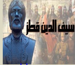
سيف الدين قُطز