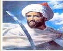
يوسف بن تاشفين