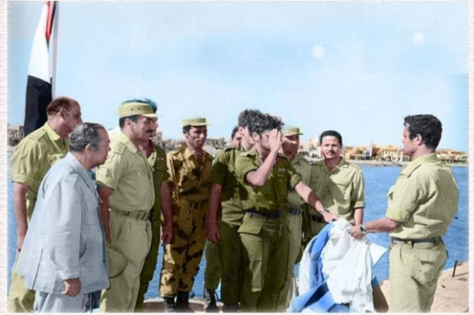
أشهر صورة في حرب اكتوبر 1973 لحظة استسلام حصن بور توفيق و تنكيس علم الصحابنة ورفع علم مصر

السادات وما أدراك من السادات؟ رجل المفاجآت وزعيم تنحني له الهامات ، ابن من ابناء مصر المخلصين ورجل من رجال العصر البارزين له في السياسة تاريخ طويل وله في الأدب فهم أصيل، صبور لا يتعجل الأمور، يجيد سياسة المحاور فهو محارب ومناور، استخف به أعداءه فهزمهم ولم يفهمه اصدقاءه فحيرهم ، صاحب أعظم إنتصار في القرن العشرين للعرب والمسلمين، كان فقيراً فأحب الفقراء ودافع عنهم وأصبح غنياً فتمنى للأغنياء دوام نعمتهم . كل أفكاره أثبتت الأيام صحتها ، سبق عصره بكثير وجاء بكل غريب ومثير ، صاحب مدرسة في التعامل مع الناس ويجيد الضرب على الوتر الحساس، فيستميل من يريد ويخيف من يحيد. خلاصة القول والختام أنه كان بطلاً في الحرب وبطلاً في السلام فندعو له بالرحمة من رب الأنام