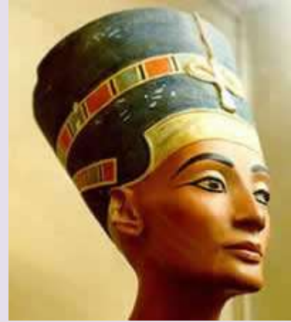
نفرتيتي في متحف برلين

الرأس البديعة للملكة الجميلة نفرتيتي زوجة الملك اخناتون ومعناها ( أجمل اللواتي جننا الى الأرض) والرأس المشاركة منحوتة من حجر الكوارتزيت البنى ، وقد عثر عليها في مدينة طيبة وتحديدًا في قصر الملك مرنبتاح .