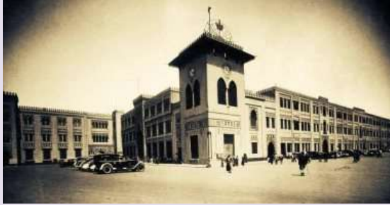
محطة مصر اثناء ثورة 1919م

مصرُ التي لا يعرفها المصريون: " تعرف على تاريخ محطة مصر وسبب تسميتها "