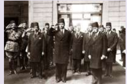
الملك فاروق الاول اثناء زيارة محطة مصر

- محطة مصر أو محطة رمسيس أو محطة القاهرة هي أكبر محطات السكك الحديدية المصرية. ويرجع تاريخ إنشاء محطة مصر إلى عام 1853.