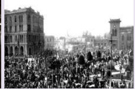
محطة مصر عند افتتاحها عام 1853م

كل ما تريد معرفته عن تاريخ محطة مصر الشاهدة على تاريخ مصر وسبب تسميتها في الماضي بمحطة باب الحديد والمراحل التي مرت بها حتى أصبحت على شكلها الحالي.