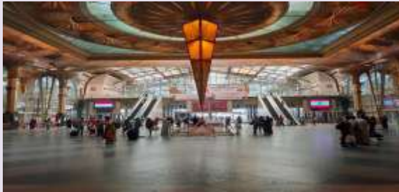
محطة مصر بعد التطوير من الداخل

كل ما تريد معرفته عن تاريخ محطة مصر الشاهدة على تاريخ مصر وسبب تسميتها في الماضي بمحطة باب الحديد والمراحل التي مرت بها حتى أصبحت على شكلها الحالي.