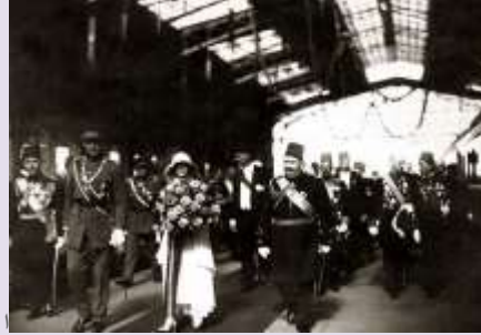
الملك فؤاد الأول مع ملك ومملكة بلجيكا في محطة مصر