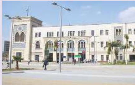
محطة مصر بعد التطوير الاخير