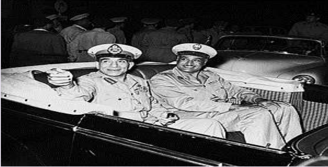
MOHAMED NAGEEB & GAMAL ABDELNASSER